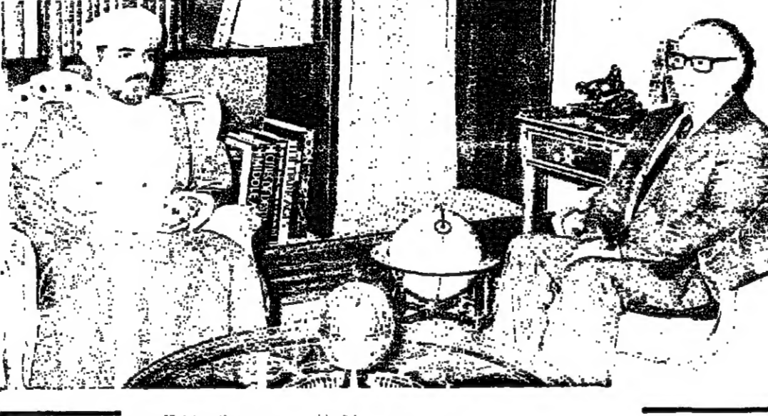
جلالة السلطان قابوس المعظم أثناء استقباله لسعادة الدكتور علي خزيمة سفير إيران بمناسبة انتهاء مهمته لدى السلطنة

يبحث مجلس الوزراء المقرر مشروع إدارة كهرباء المدن والقرى العمانية التي انتهى العمل في قسم كبير منها، ويجري استكمال العمل في باقي المحطات. ويعد مناقشة مستقبضة لتطبيقات التشغيل وبرنامج انخال هذه المحطات في الخدمة. قرر المجلس انشاء شركة وطنية عمانية لإدارة هذه المحطات وتشغيلها وصيانتها. وقد وضعت الاسس الأولى لتكوين هذه الشركة وتم تشكيل لجنة وزارية لاتمام الاجراءات اللازمة لإنشاء الشركة ودعوة المواطنين العمانيين للمساهمة فيها. وسوف يعلن ذلك في وقت لاحق، كما ستعلن تفاصيل انشاء هذه الشركة وكيفية الاكتتاب في أسهمها.